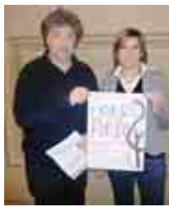
Al via domani alla Fabbrica delle Candele